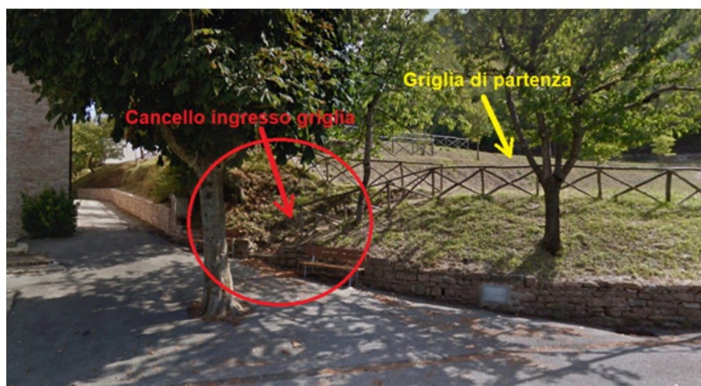
Fig. 2. Cancello d'accesso alla griglia di partenza.

Verranno fatti entrare in griglia di partenza prima gli atleti partecipanti al TRAIL di 21 km e solamente dopo la loro partenza quelli partecipanti allo SHORT TRAIL di 10 km e successivamente ai partecipanti all'ECO CAMMINATA e TRAIL NON COMPETITIVO, (Vedi Fig. 2).