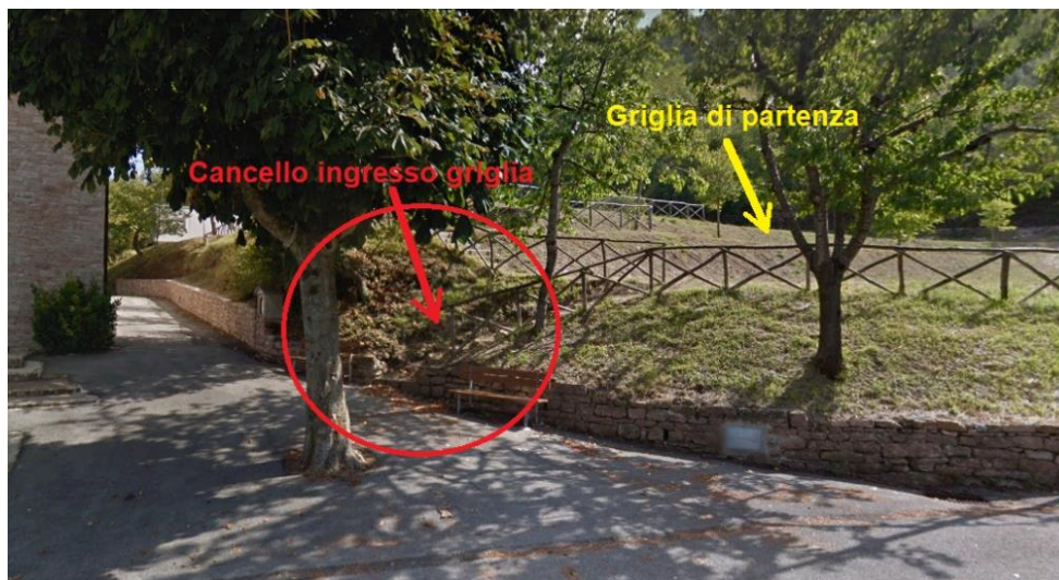
Fig. 2. Cancelli d'accesso alla griglia di partenza.

Verranno fatti entrare in griglia di partenza prima gli atleti partecipanti al TRAIL di 25 km e solamente dopo la loro partenza quelli partecipanti allo SHORT TRAIL di 13 km.